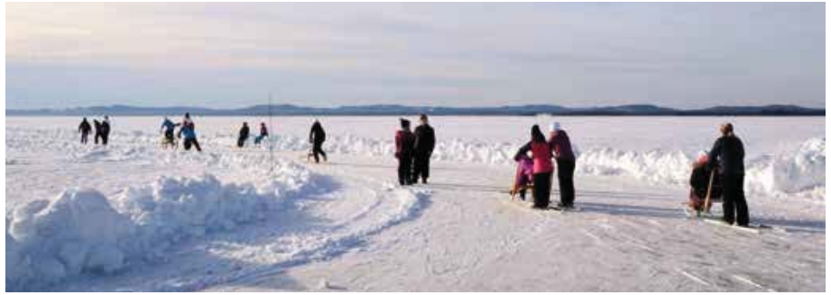
Gezellige drukte op het ijs van de Orsasjö op de schoolschaatsdag