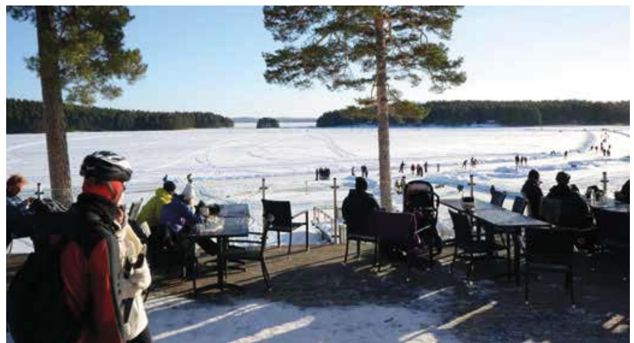
Après-skate aan de rand van het Runnmeer bij Främby Udde