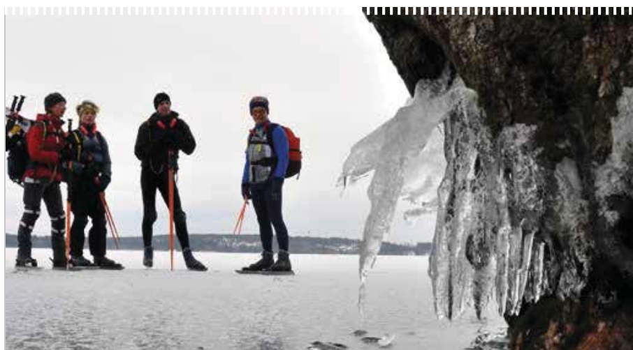
Met aandacht voor alle soorten ijs