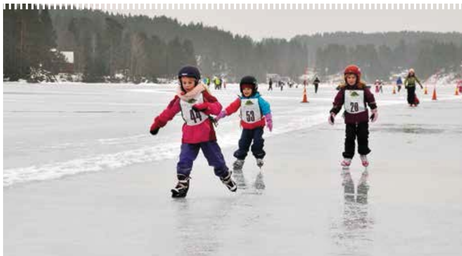
In het Noorse Stetskog schaatsen de allerjongsten hun wedstrijd

'Het leuke van het schaatsen in Scandinavië is dat het kleinschalig is en de natuur ook een grote rol speelt'